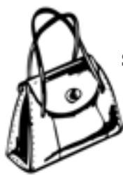
Sac à main