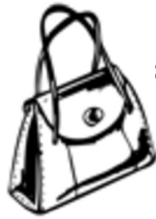
Sac à main